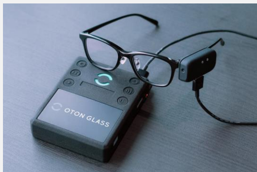
OTON GLASS 製品写真